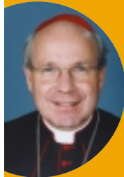
fr. Christoph Card. Schönborn OP

Our Mission We live within the tension between contemplation and action, which St. Thomas Aquinas expressed in the following words: “contemplari et contemplata aliis tradere” (transmit to others what has been experienced in contemplation). The focal points of our activities today are: ■ Catechesis in a world which has become unchristianised ■ Critical argumentation with non-Christian cultures, systems and social movements ■ Dedication to peace and justice ■ Utilisation of the media for preaching